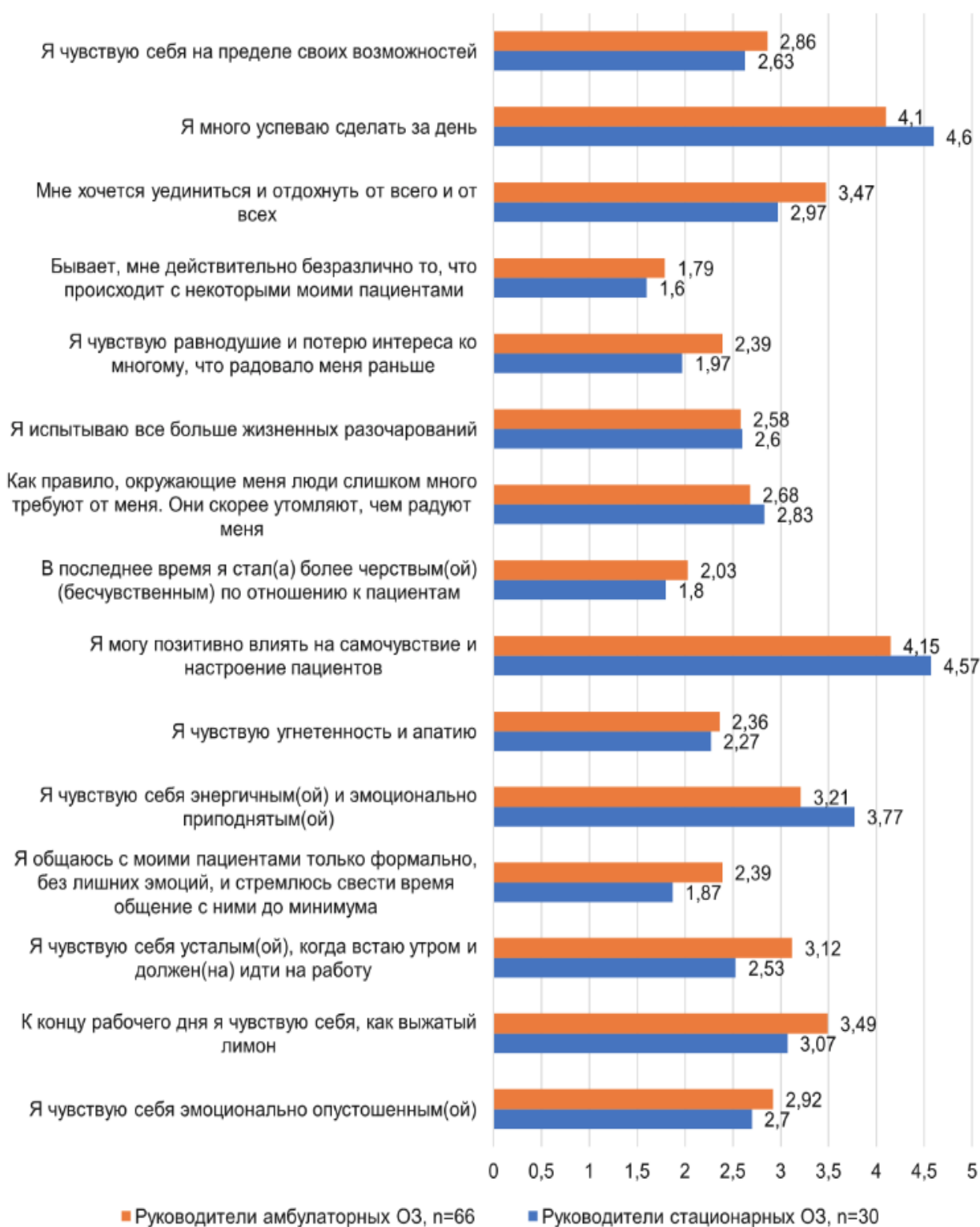
Рисунок 2. Сравнительная характеристика психоэмоционального статуса руководителей стационарных и амбулаторных ОЗ в период третьей волны пандемии COVID-19 Figure 2. Comparative characteristics of the psychoemotional status of the managers of inpatient and outpatient HOs during the third wave of the COVID-19 pandemic