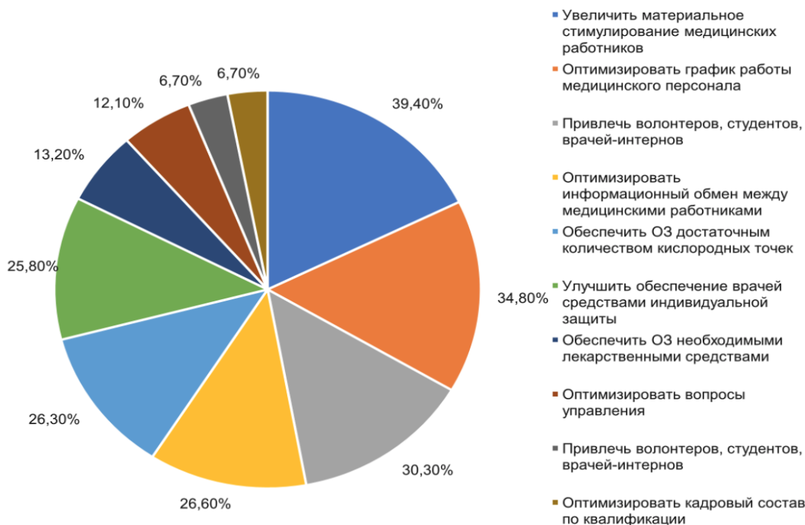
Рисунок 3. Распределение ответов руководителей стационарных и амбулаторных ОЗ в период третьей волны пандемии COVID-19 по вопросу изменений организации работы ОЗ для повышения эффективности лечения пациентов с COVID-19