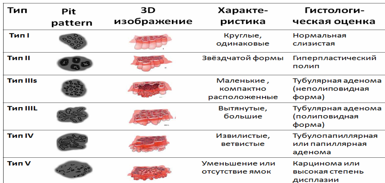
Таблица 2 — Классификация поверхностного строения рисунка эпителия по Kudo в толстой кишке

За последние десятилетия значительно улучшилось качество эндоскопического изображения благодаря внедрению видеэндоскопических систем высокого разрешения, обладающих функциями повышения контрастности изображения слизистой оболочки. Стало возможным рассмотреть не только мелкие структуры эпителия, но и сосудистый рисунок. При эпителиальной неоплазии помимо изменения структуры желез происходит изменение сосудистого рисунка. Предпринимаются попытки выявить корреляцию между типом ямочного и сосудистого рисунка с гистологической картиной. На основе перестройки структуры ямок эпителия и сосудов было разработано несколько классификаций, доступных для оптической диагностики неоплазий и инвазии с использованием изображения в узком спектре (Narrow Band Imaging — NBI). Это — классификация Сано (Sano), Хирошима (Hiroshima), Шова (Showa) и NICE (NBI International Colorectal Endoscopic Classification) [11–14]. Несмотря на то, что в настоящее время Европейской организацией гастроинтестинальной эндоскопии предложено использовать стандартную или виртуальную (а именно NBI) хромоскопию с увеличением для предсказания риска инвазии в подслизистый слой, однако отсутствует единая признанная классификация диагностики неоплазий на основе сосудистого рисунка [15].