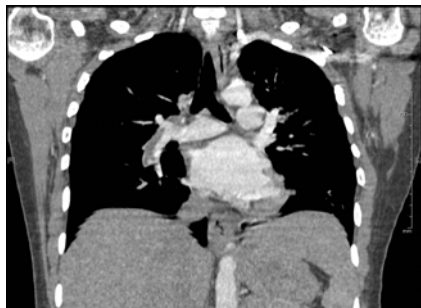
Рисунок 1 — РКТ органов грудной полости, обзорная локализующая топограмма органов грудной полости

Заключение: КТ-картина ТЭЛА (тромбоэмболия крупных ветвей легочной артерии с обеих сторон) (рисунки 1, 2, 3).