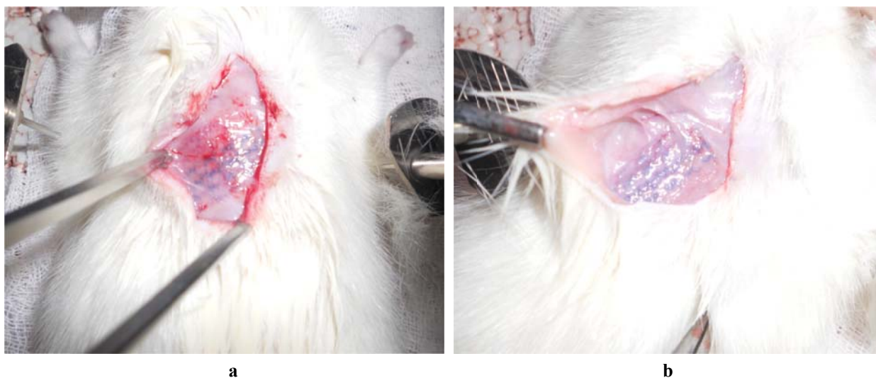
Рисунок 2 — Забор имплантированного эндопротеза без покрытия (а) и покрытого поликапролактоном (б)

Сравнительный показатель реакции тканей на имплантацию определяется как разница между итоговым средним количеством баллов исследуемого и контрольного образцов. Отрицательная разница, получающаяся при определении среднего показателя, записывалась как ноль. В результате оценки опытный образец может быть признан: 1) нераздражающим (средний показатель от 0,0 до 2,9); 2) легким раздражителем (средний показатель от 3,0 до 8,9); 3) умеренным раздражителем (средний показатель от 9,0 до 15,0); 4) сильным раздражителем (средний показатель больше 15,0).